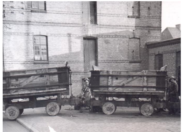
Tipvognsspærringen foran Slotsvandmøllen. Maskingeværgruppen ses mellem tipvognene.

Kroghs grupper fik ordre til at gå i stilling på Sønderbro, og befæste broen foran Slotsvandmøllen. Soldaterne blokerede vejen fra Åbenrå med tipvogne, fra et nærliggende jernbanespor. Tipvognene gav dog ikke soldaterne synderlig dækning.